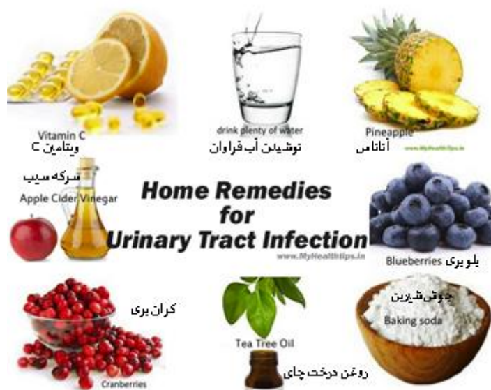
شکل ۲ درمان های خانگی عفونت مجاری ادرار